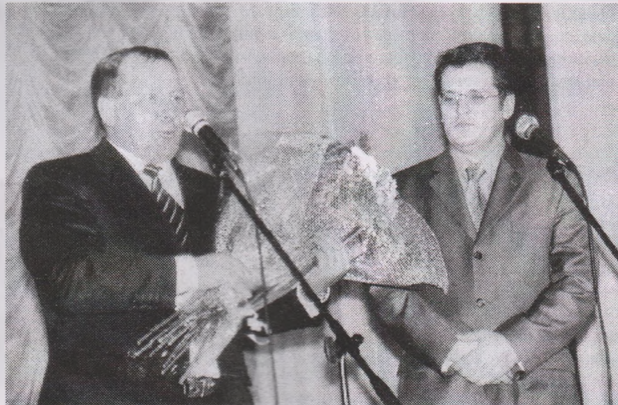
«Человек — золотое сердце»