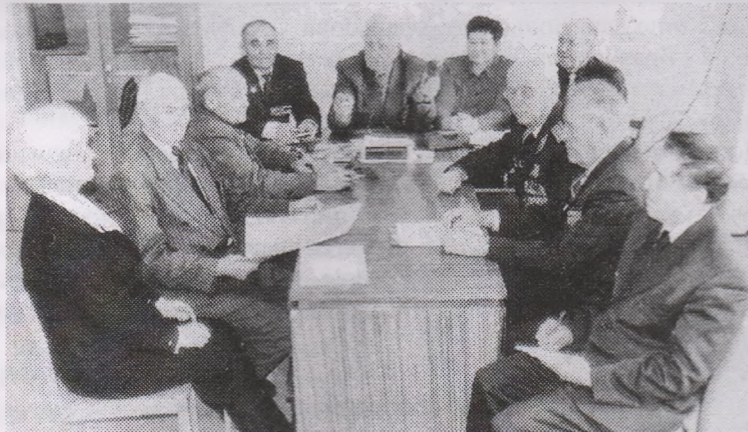
Активисты ветеранского движения